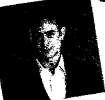
พิช พุ่มแกล้องล่า

ครั้งแรก! กับ Online Event ที่จะชวนคนมาร่วม จับตากริ๊งงบประมาณ 400,000 ล้านบาท แบบ 4.0 กับ