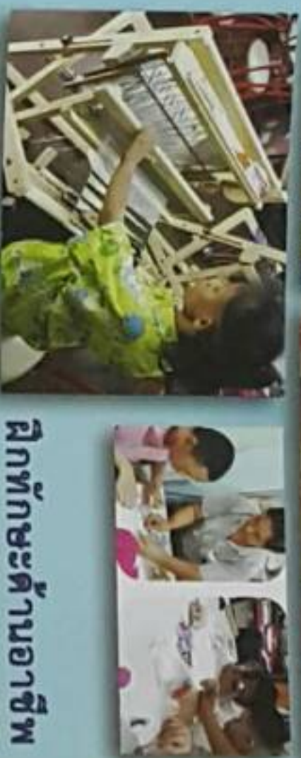
ฝึกทักษะด้านอาชีพ