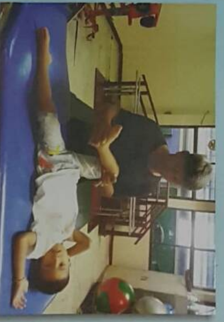
กายภาพบำบัด