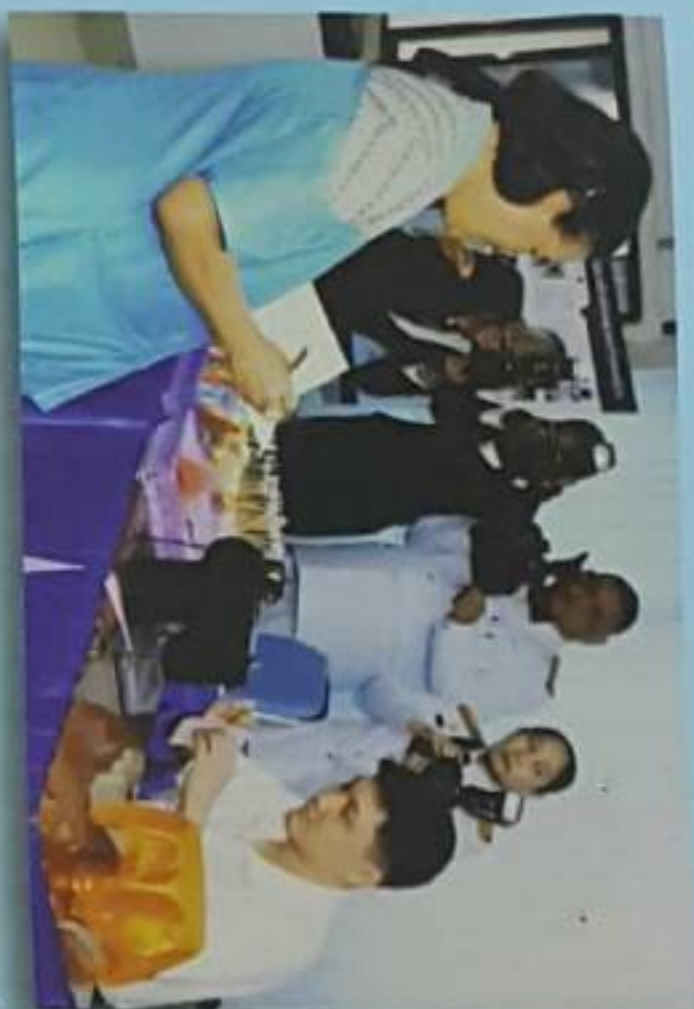
สมเด็จพระเทพรัตนราชสุดาฯ สยามบรมราชกุมารี เสด็จทอดพระเนตรกิจกรรม ค้านอาชีพคนพิการทางสติปัญญา

มูลนิธิฯ ได้ตระหนักถึงปัญหาของประชากรที่พิการทางสติปัญญาในประเทศไทย ซึ่งมีแนวโน้มจะทวีความรุนแรงและซับซ้อนมากยิ่งขึ้น ซึ่งจะแก้ปัญหาในการพัฒนาประชากรของประเทศโดยส่วนรวม มูลนิธิฯ นอกจากรจะมีศูนย์ฯ ให้บริการแก่คนพิการทางสติปัญญา 10 แห่ง ครอบคลุมทุกวัยอยู่แล้ว แต่ก็ได้ทำงานเชิงรุกถึงผู้ชมบทั่วประเทศ เพื่อบรรเทาปัญหาแต่เริ่มแรก ทั้งการกระตุ้นพัฒนาการ การศึกษาและการฝึกอาชีพ มูลนิธิฯ ได้จัดตั้งศูนย์ส่งเสริมเฉลิมพระเกียรติ 84 พรรษา พัฒนาคุณภาพชีวิตผู้พิการทางสติปัญญาแบบครบวงจร ซึ่งจะต้องใช้งบประมาณเป็นจำนวนมากในการดำเนินงาน จึงได้ร่วมกับกองทัพบกและสถานีวิทย์ทหารที่บกกองทัพบก จัดรายการพิเศษ “วันรวมใจประชา เมตตาปัญญาอ่อน” ในวันพฤหัสบดีที่ 12 กรกฎาคม 2561 เวลา 22.30-00.30 น. ทางสถานีวิทยุโทรทัศน์กองทัพบก ทหารรายได้เพื่อขยายบริการให้ผู้ที่พิการทางสติปัญญาได้มากยิ่งขึ้น ความเมตตาของท่าน จะเป็นกำลังใจสำคัญในการช่วยเหลือผู้พิการทางสติปัญญา ให้ได้รับการพัฒนาคุณภาพชีวิตที่ดีต่อไป ขอเชิญท่านผู้มีจิตกุศลได้โปรดร่วมบริจาคเงินสมทบทุนช่วยเหลือคนพิการทางสติปัญญาครั้งนี้ด้วย