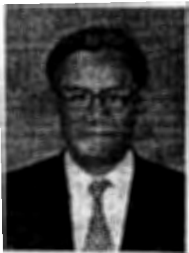
นายอิทธิพร บุญประคอง อดีตอธิบดีกรมสนธิสัญญาและกฎหมาย และอดีตเอกอัครราชทูต ณ กรุงไนโรบี สาธารณรัฐเคนยา และกรุงเฮก ราชอาณาจักรเนเธอร์แลนด์