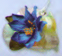
ถุงแก้วกัลยา (พิมพ์เส้น+ยี่ห้อของ.) ราคา 75.- บาท