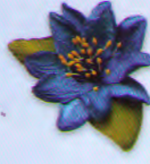
ดอกเดี่ยว ราคา 20.- บาท