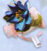
ยี่ห้อของแก้วกัลยา ราคา 45.- บาท