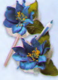
ปากกาแก้วกัลยา ราคา 30.- บาท