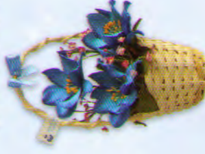
กระเช้าจิว (10 x 14 ซม.) ราคา 120.- บาท