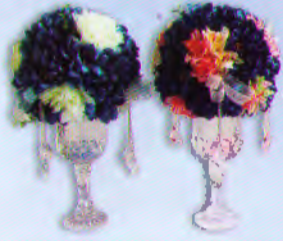
แจกันแก้ว (20 x 30 ซม.) ราคา 1,260.- บาท