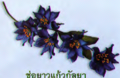
ช้อยาวแก้วกัลยา ราคา 120.- บาท