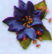
ดอกไม้เดี่ยวมีดอกไม้ไม้แซม ราคา 50.- บาท