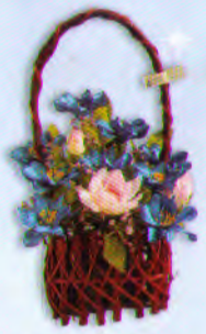
กระเช้าใหญ่ (20 x 28 ซม.) ราคา 450.- บาท