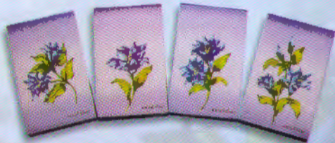
สมุดโน้ตแก้วกัลยา (9 x 15 ซม.) ราคา 50.- บาท