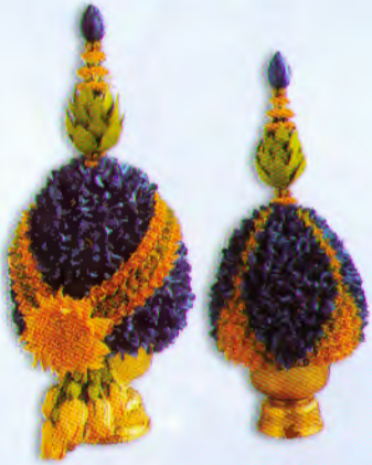
พานพุ่มใหญ่ (22 x 47 ซม.) ราคา 2,500.- บาท