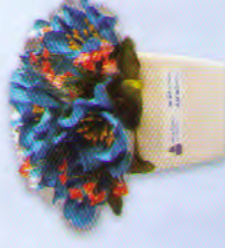
กระถางจิว (10 x 12 ซม.) ราคา 200.- บาท