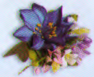
แม่ก้นแก้วกัลยา ราคา 75.- บาท